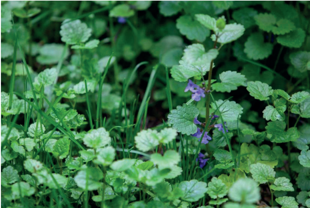
Lierre terrestre ( Glechoma hederacea )