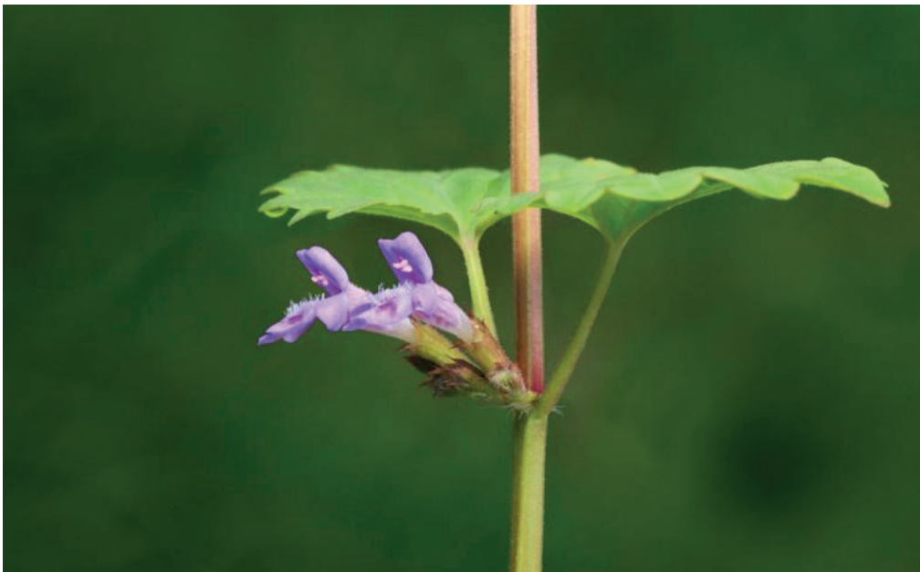
Feuilles opposées et tige carrée de Lierre terrestre ( Glechoma hederacea )