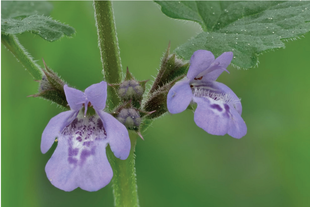
Fleurs à deux lèvres et tachetées au centre de Lierre terrestre ( Glechoma hederacea )