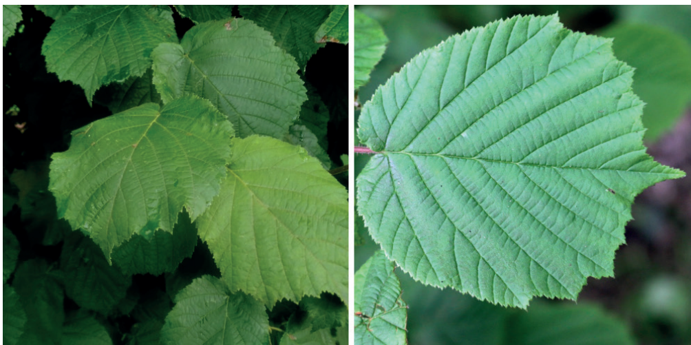
Feuilles de Noisetier ( Corylus avellana )