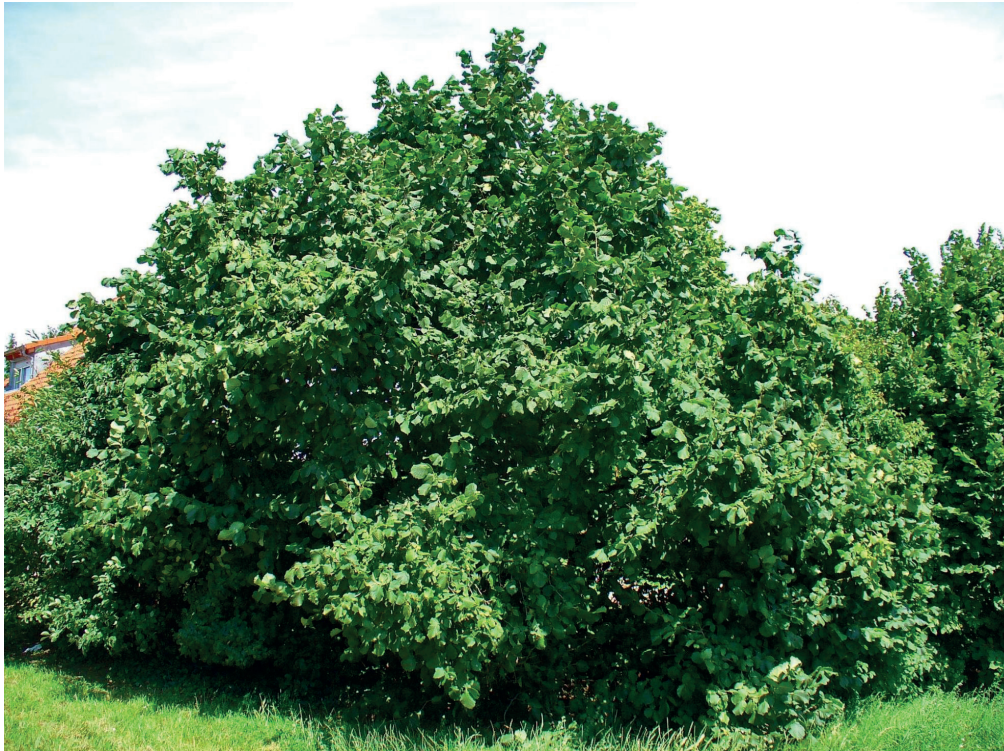
Noisetier ( Corylus avellana )