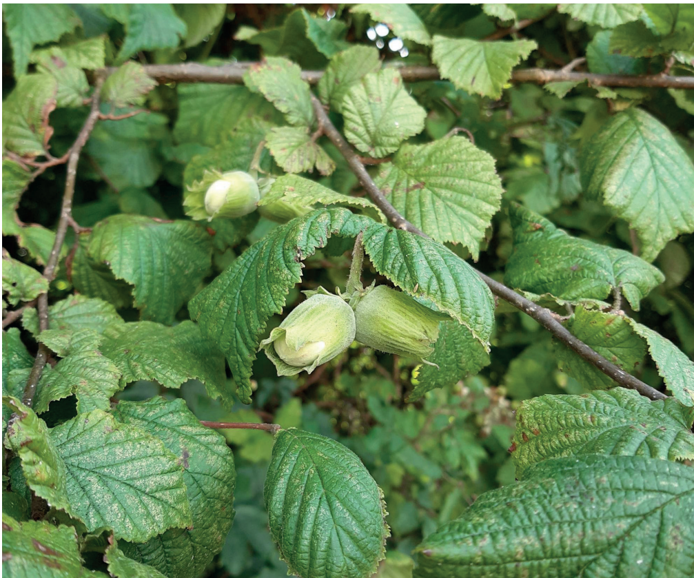
Jeunes noisettes, fruits du Noisetier ( Corylus avellana )