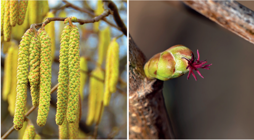
Chaton mâle (à gauche) et fleur femelle (à droite) de Noisetier ( Corylus avellana )