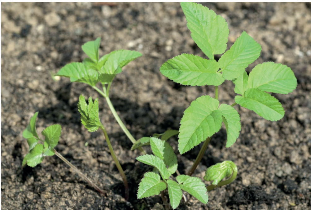
Très jeunes feuilles d'Égopode ( Aegopodium podagraria )