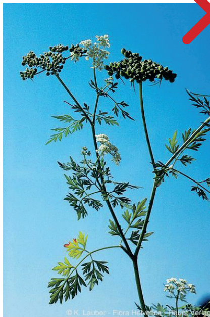
Feuilles composées de folioles très finement découpées de Petite Ciguë ( Aethusa cynapium )