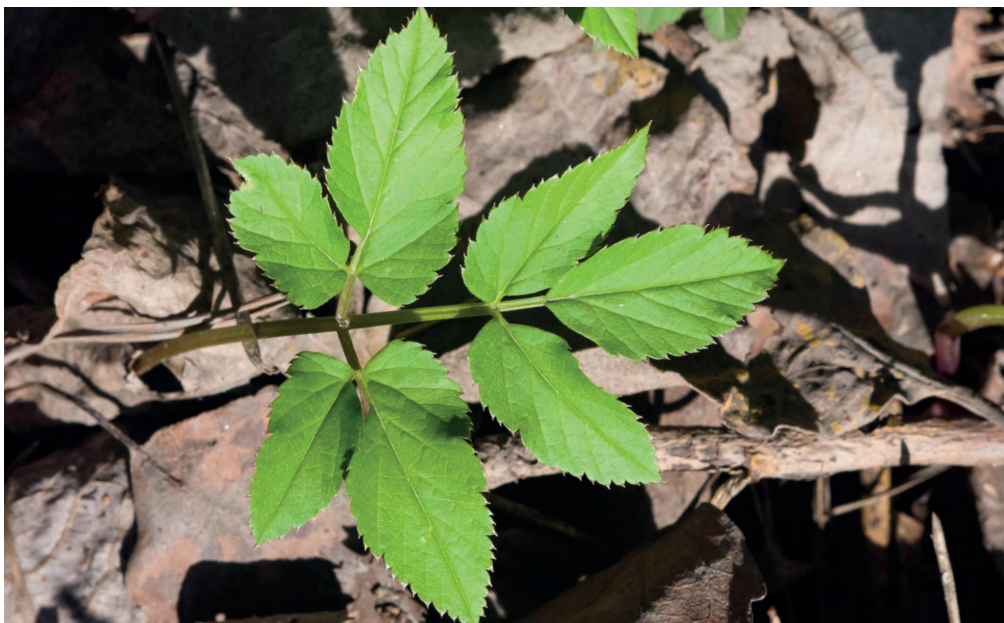
Jeune feuille d'Égopode ( Aegopodium podagraria )