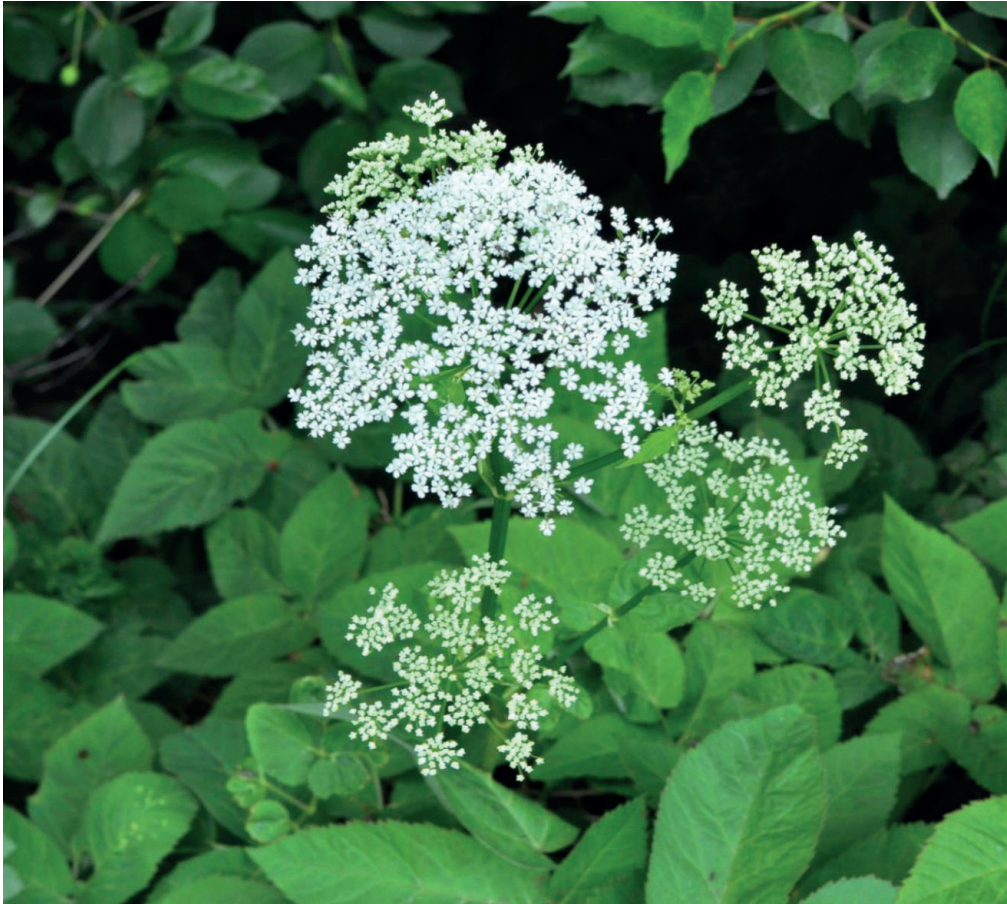
Égopode ( Aegopodium podagraria ) en fleurs