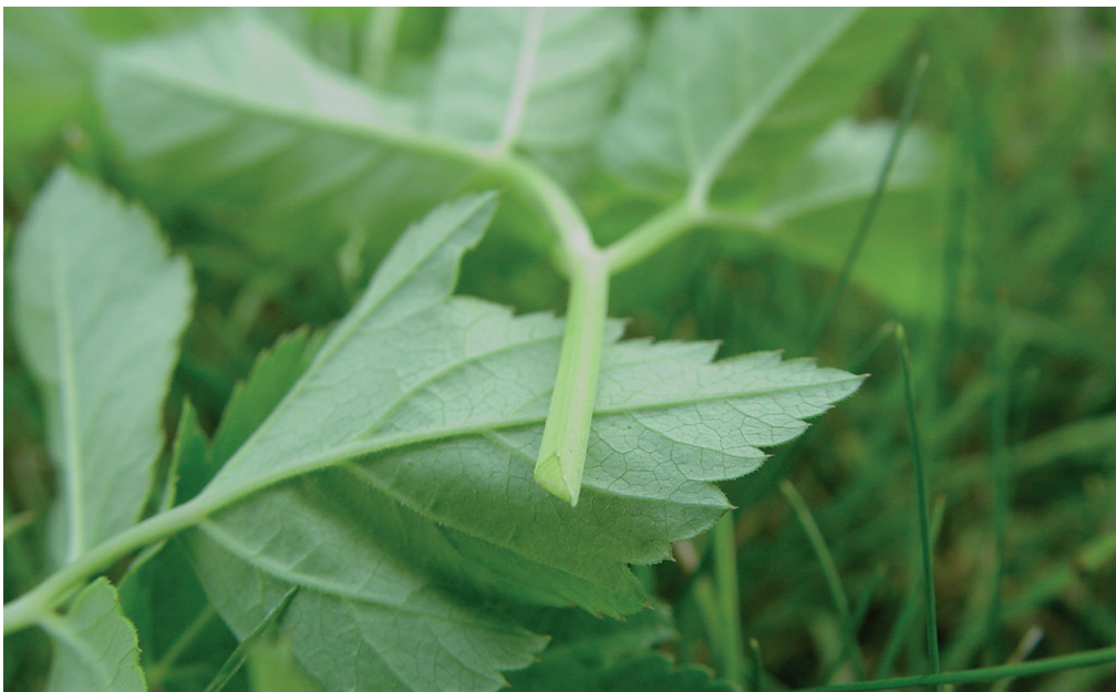
Pétiole triangulaire d'Égopode ( Aegopodium podagraria )