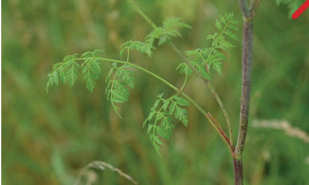
Feuille composée de folioles très finement découpées et tige tachetée de Grande Ciguë ( Conium maculatum )