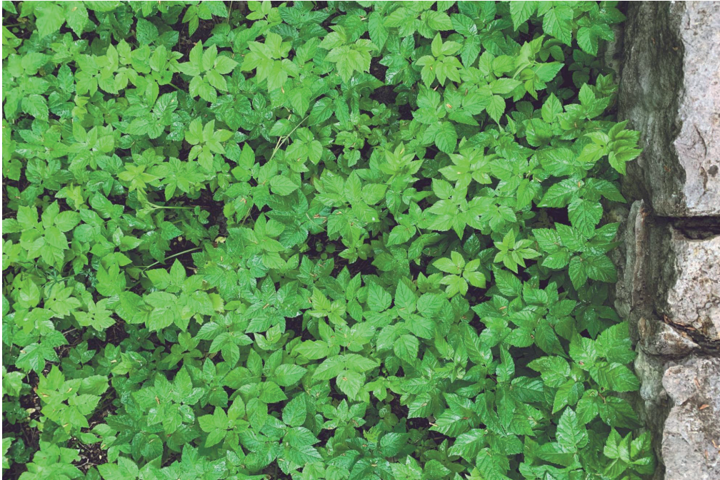
Parterre d'Égopode ( Aegopodium podagraria )