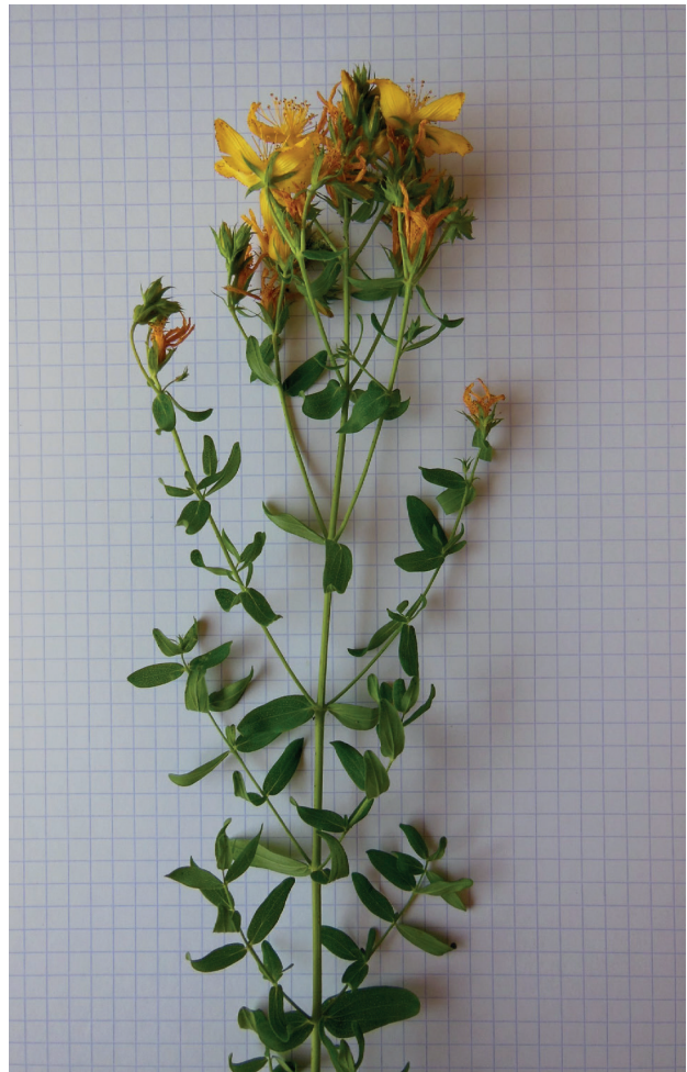
Millepertuis perforé ( Hypericum perforatum )