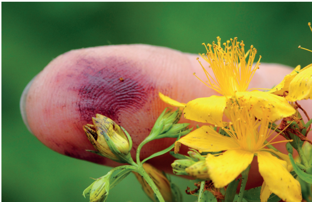
Boutons et fleurs de Millepertuis écrasés, pigment rouge