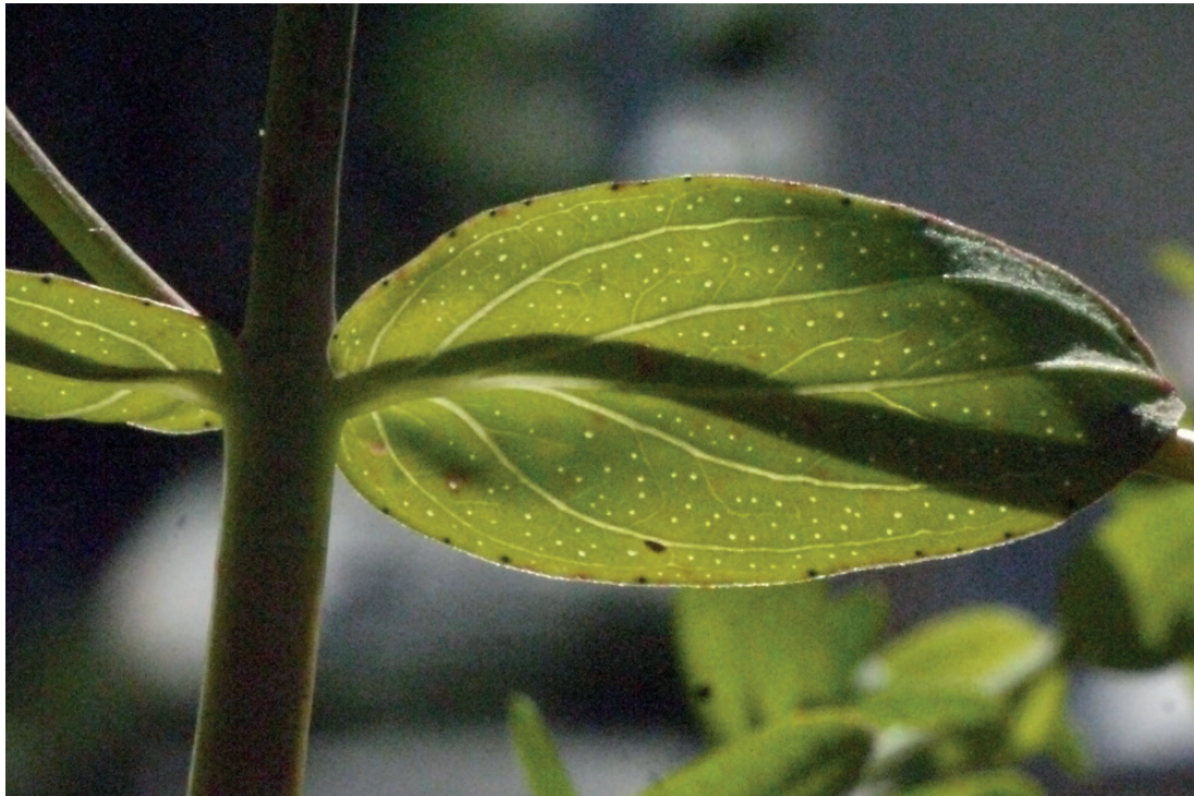
Feuille sessile de Millepertuis perforé ( Hypericum perforatum )