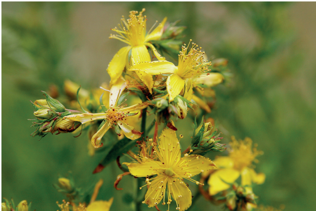
Inflorescences de Millepertuis perforé ( Hypericum perforatum )