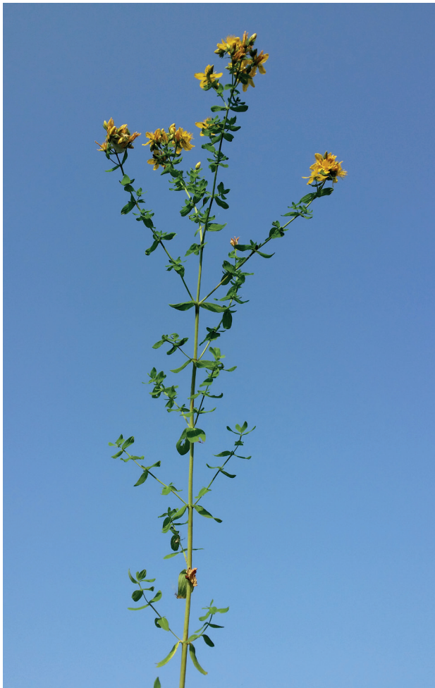
Millepertuis perforé ( Hypericum perforatum )