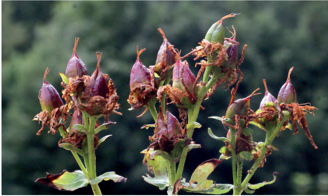
Fruits de Millepertuis perforé ( Hypericum perforatum )